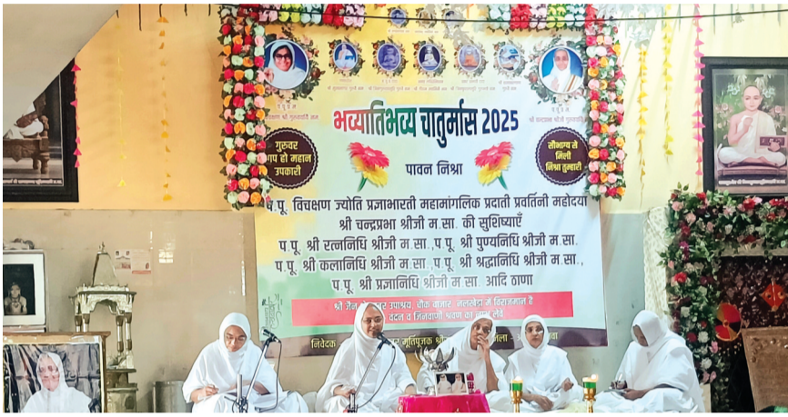
हरिभूमि न्यूज़ | नलखेड़ा

पर्युषण महापर्व के आठ दिनों में हमें एक-एक कर्मों का क्षय करना है। जो धर्म को पकड़ कर रखता है, धर्म उसकी विपत्ति आने पर अवश्य ही रक्षा करता है। अनादि काल से भव - भ्रमण के बाद हमें यहां दुर्लभ मानव जीवन मिला है, इस जीवन का सदुपयोग कर इसे धर्म कार्य, पुण्य कार्य में लगाए तभी हमारा यहां जीवन मिलना सार्थक होगा। आगम शास्त्र हमारे लिए अंधेरे में प्रकाश के समान है, जो हमें धर्म मार्ग पर चलने की राह दिखाते हैं। अभय दान सबसे बड़ा दान है, जयणा एवं जीव दया इसके अंग है। स्थानीय जैन श्वेताम्बर समाज में चल रहे आठ दिवसीय पर्युषण महापर्व में अष्टान्हिका व्याख्यान के दौरान प.पू.प्र.म. चंद्रप्रभा श्री जी. म. सा. की सुशिक्षा प.पू. रत्न निधि म.सा. द्वारा समाजजनों के समक्ष यहां विचार व्यक्त किये। साध्वी जी ने कहा कि कर्मों से मुक्त होना ही जीव का मोक्ष है दर्शन, ज्ञान, चरित्र की समन्वित साधना ही मोक्ष मार्ग है। जीवन में अहिंसा एवं वीतराग धर्म धारण करने वाली भव्यात्मा आज नहीं, तो कल अवश्य ही धर्मात्मा बन, परमात्मा बन सकती है। इसके लिये उस जीव को संयम, तप, त्याग, चरित्र आदि का मार्ग अपनाना होगा। साध्वी जी ने कहा कि जीवन का महत्व क्रियाएं करने से नहीं,